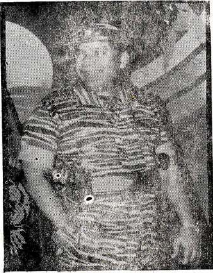
“வெரித்தால்” வெள்ள வீழா நிகழ்விற்கு ஒயிடு தேசியத் தலைவர் மேற்கு வே. பிரபாகரன் அவர்கள் வழங்கிய வாழ்த்துச் செய்தி “வெரித்தால் தம்பியணி” அடிபணிந்து போகாமல் நீதாய்ப்புக்கம் நிற்கிறது

திட்டமிட்ட வகையில் அமைதி முயற்சிக்கு ஒத்தகம் விளைவித்துவரும் சிங்கள அரசின் எதிர் செயல்களை உலக சமுதாயம் குறிப்பாக நேர்மையே அரசு புரிந்துகொள்ளவேண்டும்.