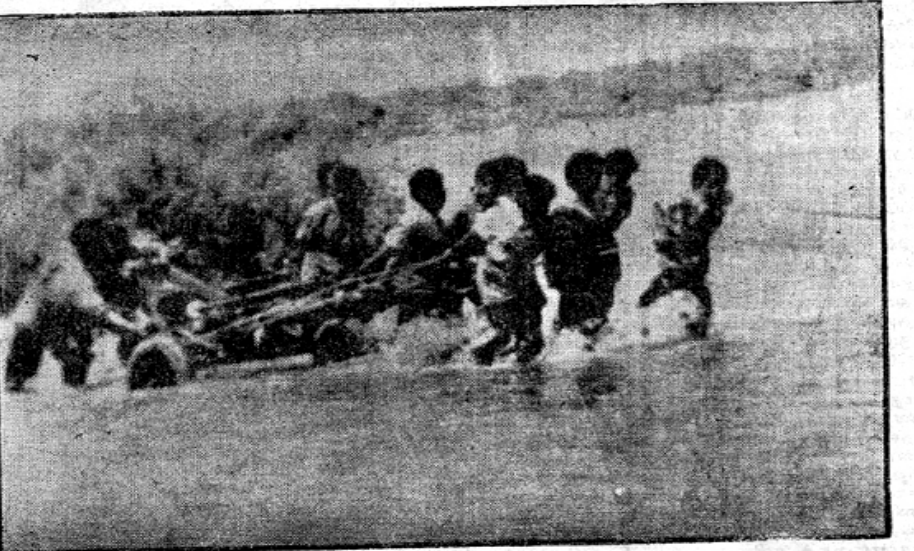
120 ஈன பிரங்குகளை நேருடாக நகர்த்தும் புலிவீரர்கள்: கீட்டு பிரங்கிப் பணியினர்! சூட்டாதரவு, புலியணிகளுக்கு புதரத்தம் போன்றது!