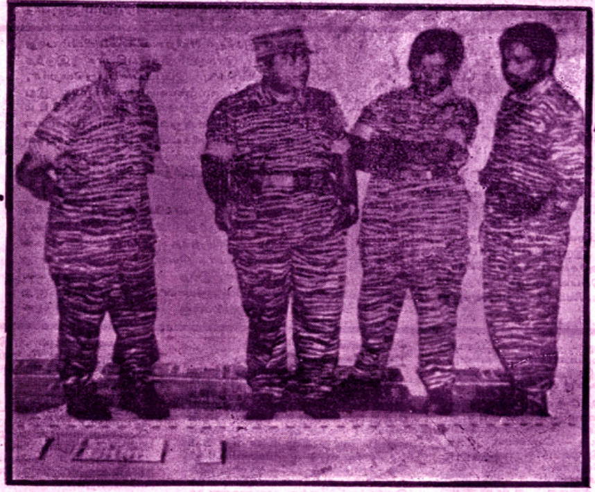
புலிப்படை வீழ்ந்து வெளியேறிய சிங்களப்படை வீரர்கள். இவர்கள் போர்வாழி விழந்ததுகாண்! பாழாக்கி, பகைவாலும் யாழ்மன்னின் துயர்போக்க புலியணிகள் பாய்ந்தனகாண், தலைவர் படைநடத்த!

என்ற பேரினவாத நிலைப்பாட்டை சத்திரிகா அரசாங்கம் மாற்றியமைக்க முயலவில்லை. அரசுபொருளாதாரத்தின் கணிசமான பகுதியை போருக்குச் செலவிட்டு - இப்போது அதையும் போதாதென்று போர்க்கால நிலையைப் பிரகடனப்படுத்தி மேலும் பண ஒதுக்க (2 ம் பக்கம் பார்க்க) →