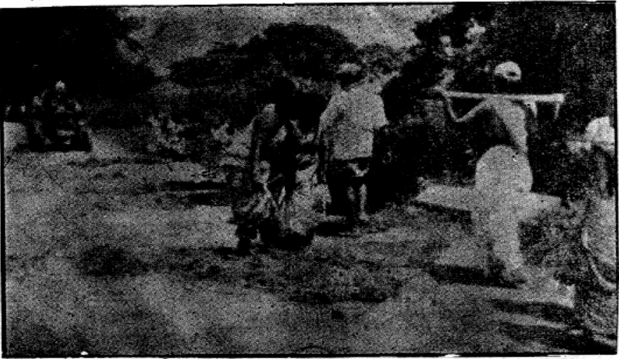
ஓயாத அவைகள் - 03 பெருஞ்சமர் : விதி செப்பனிடும் மகன்