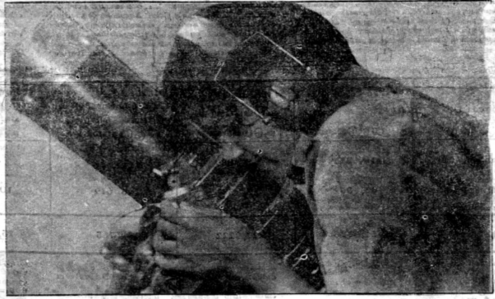
“இங்கு வெகு நெருக்கம்...” - எற்கணை காங்கியல் எழுப்புகின்ற சந்திரிகா அரசாங்கம், தமிழகத்தைப் பிழைப்பா முடிந்திருக்கிறது

1500ற்குக் குறையாத ஆட்வரி செய்கள் வெடித்துச் சிதற்பதாக கொழும்பு இராணுவ வட்டாரங்கள் தெரிவித்தன. தனக்கீழ் மிகத் துக்கியமான எற்கணைவிசிறின