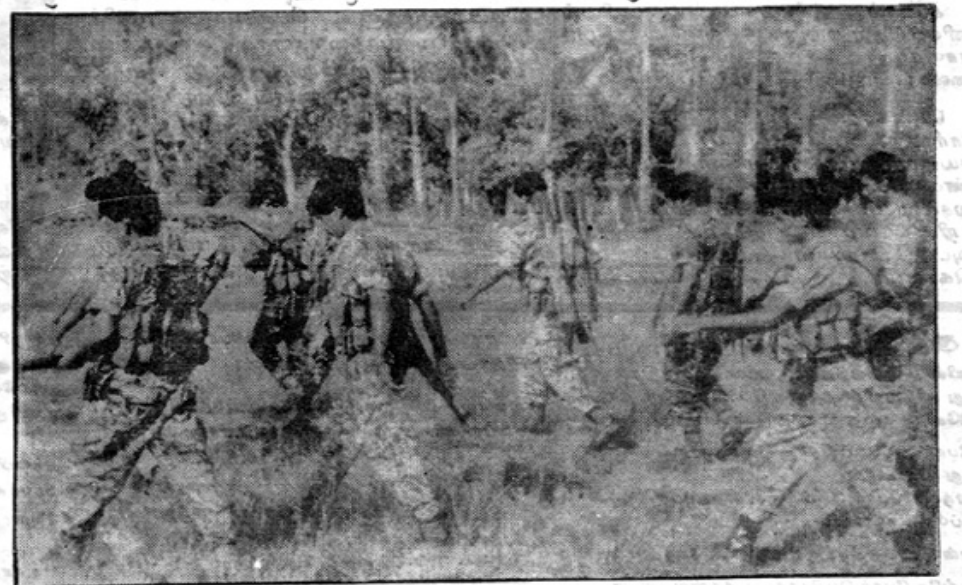
புலி தோள்மீது சுடுகுழல் - இனி பகைவிடு எரிதழல்