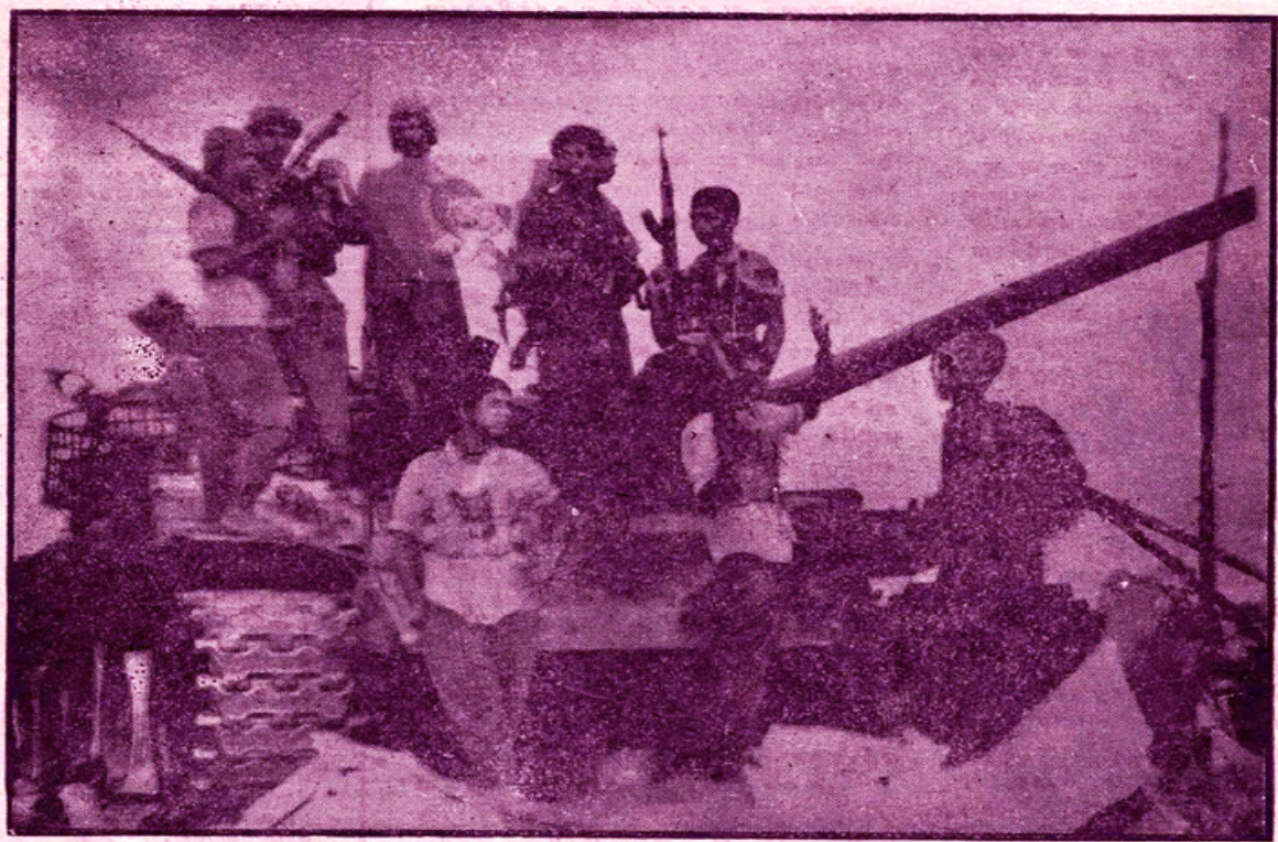
மாங்குளத்து மண்பிடிக்கத் தாவிவந்த திமிர்பிடித்த இருபரண் - சிறையெடுத்த உலகைப்பொங்க ஏறிவிளையாடும் வேங்கைகள்.

படையினர் பவியாகியிருந்தனர். 300ற்கும் மேற்பட்ட படையினர் காயமடைந்திருந்தனர். மாங்குளத்தைக்கைப்பற்ற முயன்ற பகைவனின் முயற்சி படுதோல்வி கண்டது. தாக்குதலை ஆரம்பித்த இடத்திற்கே எதிரி விரட்டியடிக்கப்பட்டிருந்தான். ஜயசீக்துறவன் துருப்புகளுக்கு நம்பிக்கையை ஊட்டி - அவர்களை உற்சாகப்படுத்தும் ஒரு இராணுவ நிகழ்ச்சியாக மாங்குளக் கைப்பற்றுகையை படைத்தலைமை கருதுகின்றது. மாங்குளத்தைக் கைப்பற்ற பகைவன் பல தடவைகள் சண்டைபோட்டுள்ளான். ஒவ்வொரு முயற்சியின்போதும் வெல்வறுவகையான நகர்வுத்தந்திரங்களைப் பயன்படுத்திவருகின்றான். எனினும் எடுத்த அனைத்து முயற்சிகளிலும் தோறிப்படை தோல்விகண்டுள்ளது. துருத்தப்பாதினும் மேலும் = மேலும் முயற்சிகள் செய்ய படைத்தலைமை தயார்படுத்தல்களைச் செய்கின்றது. ஜயசீக்துறவ சமரின் தலைவியியை நிர்ணயிக்கும் ஒரு தீவிர சண்டைக்களமாக மாங்குளம் மாறிவிட்டது.