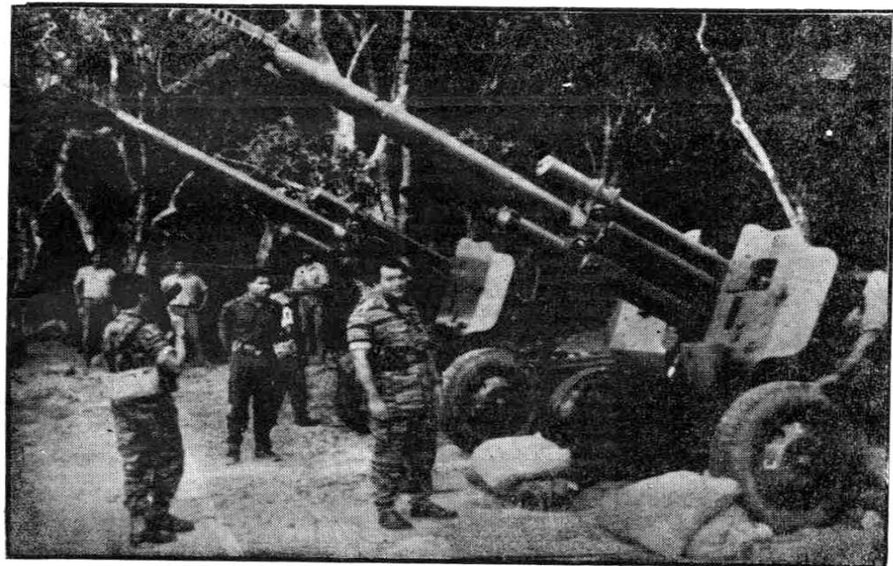
கைப்பற்றப்பட்ட மரபுப்போர் ஆயுதங்களுடன் தலைவர் பிரபாகரன்

இந்தநிலையில் தமிழரின் விடுதலைச்சேனையாகிய புலிப்படையின் இராணுவ பலத்திலேயே தமிழினத்தின் அரசியல்வெற்றி தங்கியிருக்கின்றது, இந்த