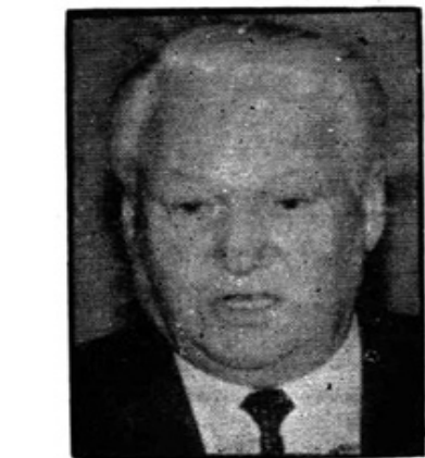
போரில் யெல்ட்சின்: இன்னும் எவ்வளவு காலம்?

இவையெல்லாம் ஒருபுறமிருக்க, மீண்டும் செச்செய் ரிக்கல் எரிமையைக் வெடித்து - பூதமாக யெல்ட்சினைப் பிந்தொடர்சின்றது. முன்னைய பாதகாப்பு அமைச்சரும் இராணுவத்தின்