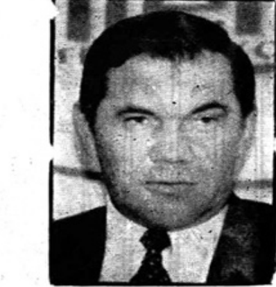
அலெக்சாண்டர் லெபெட்வீ: அடுத்தது யோகம்!

திமிர் நிரம்பியவருமான பாலெக் ரிச்சேவிசை கையைக் கேட்டு செச்செய்யா மீது படை உருத்த டிசெம்பர் 11, 1994 ஆம் ஆண்டுகிறதும் இன்னுவரை, புகழ்சேற்றுக்குள் காணடடையையில் யெல்ட்சினிருப்பதும்; செச்செய்யாப் போர் தொடர்ந்தால் நெற்றியில் தோவணி நிச்சயம் என்வின்ற நிலையின், "பலங்கரவாதி கூற", "கொவளைகாரர்" எனத் தானே கூறிய போராடிகளை மொஸ்கோவிற்கு அழைத்து - விடுத்து வைத்து - போர் நிறுத்தம் கொண்டு வந்த கையம் தெரிந்ததே. இப்போது மீண்டும் செச்செய்ய ரிக்கல் மேலெழுமின்றது. "குறிப்பிட்ட கால எல்லைக்குள் ருஷ்யப் படைகள் விவகரிட்டால் மீளும் போர்" என முழக்கமிடும் செச்செய்யாவினை தற்போதைய தலைவரான லெலியான யஸிர் பிசெல், மோதலுக்குத் தயாராகின்றார். இப்போது லெபெட்வீ எனச் செயல்பாவினாரா? செச்செய்யாவில் இராணுவத் தலைவர்படைக் கண்டித்தும், விளாக ருஷ்யப் படையினர் இரப்பதை அனுமதயேன என்றும், செச்செய்ய சுதந்தரம் பற்றிக் கவனத்தரமுகு எடுப்பின் என்றும் யுத்தவரை கூறிய அவர், இனி எனச் செயல்பாவினாரா என்பதே, உலக அரசியல் எழுத்துகளே கேள்வி. "நாசி புத்தி" நிரம்பிய யெல்ட்சின் இனிமேல் லெபெட்வீடை எவ்வாறு கையாளுவார் என்பது, இன்னொரு கேள்வி. இத்தச் சிக்கல்கிடைதல், புகழ்புத்த பொதுவுடைமைப் புரட்சியின் 'முத்த குடிகள்' எனப்பட்ட ருஷ்ய மக்கள், முடிவு தொழித - ஊடிவு தொழித - புரட்சி செய்வ நிலையமைக்காவிட்டெனர் என்பதே, இன்றைய ருஷ்யாவின் உண்மை நிலையாகும்!