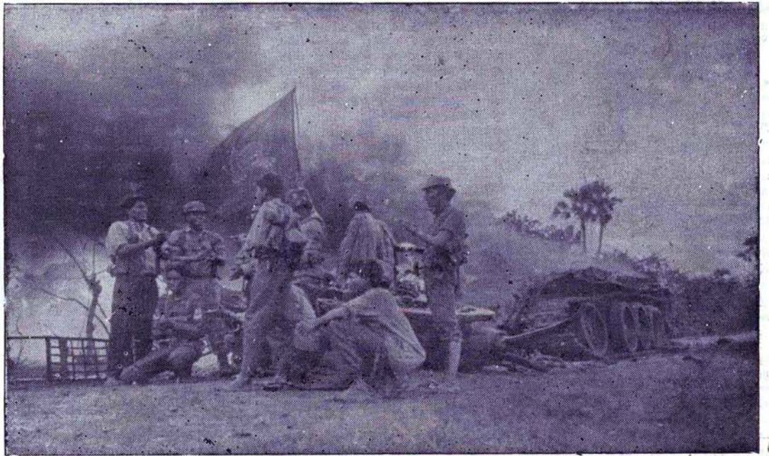
பூநகரியில் புலிகள்: எதிரியின் பாசறை எங்கே?..... பிரபாகரன் பிள்ளைகள் அங்கே!

தமிழீழ விடுதலைப்புலிகளின் அதிகாரபூர்வ ஏடு