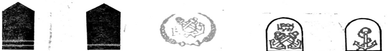
மாஸ்டர் சீப் பெற்றி ஓஃபிசர் Master Chief Petty Officer பிளீட் சீப் பெற்றி ஓஃபிசர் Fleet Chief Petty Officer சீப் பெற்றி ஓஃபிசர் Chief Petty Officer பெற்றி ஓஃபிசர் Petty Officer லீடிங் சீமன் Leading Seaman