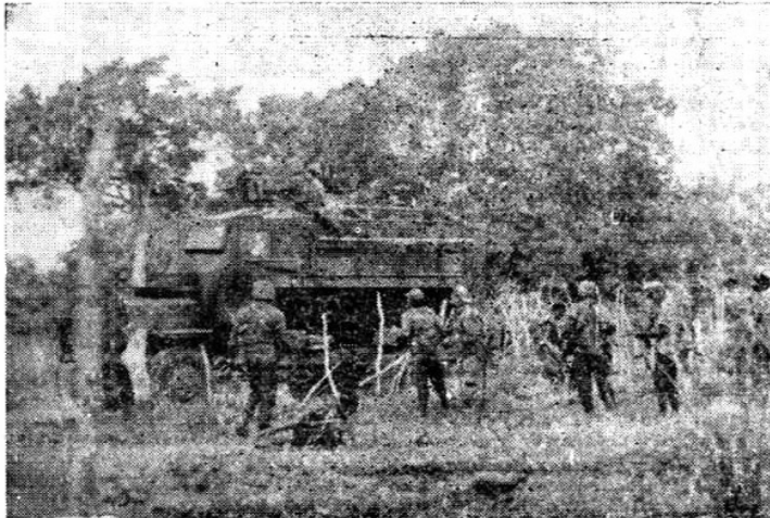
04-08-1992 அன்று, வவுனியாவில் சிங்களப்படைமீதான தாக்குதலில் போது எம்மால் கைப்பற்றி அழிக்கப்பட்ட 'பவர்' கவச பண்பு.

இதனால், வேறொரு இடத்தில் இராணுவ நடவடிக்கையை நடாத்துவதற்கு இராணுவப்பீடம் பல சிக்கல்களையும் அபாயங்களையும் எதிர்கொள்ளும் சாத்தியம் உள்ளது.