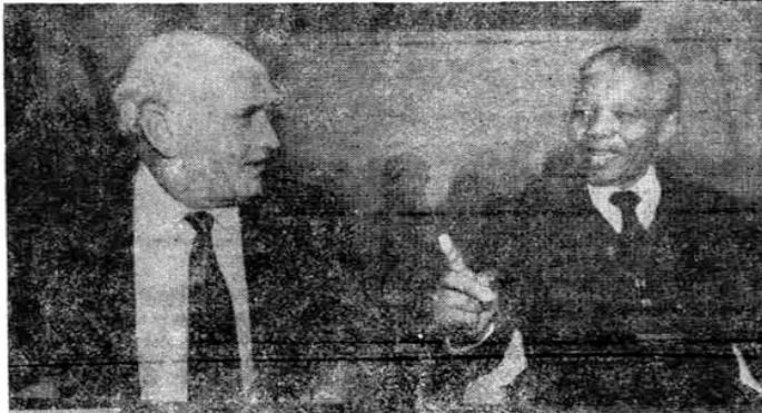
ஜனாதிபதி டி. கிளார்க்குடன் நெல்சன் மண்டேலா

உலக நாடுகள் பல தங்களது உறுவுகளைப் புதுப்பித்துக்கொண்டன. தென்னாபிரிக்கா மீது பொரு