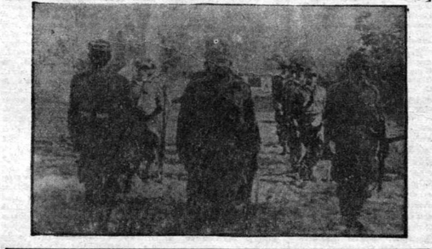
எழுபதுகளில் வன்னிக் காட்டில் தலைவர் பிரபாகரனிடம் பயிற்சி பெறும் எமது ஆரம்பகால உறுப்பினர்கள்

யாரானும் தக்கிற் குப்புறப்புகாமலே இத்த தலைவிரித்தாயுத அரசியல் வன்முறை எழுச்சியும், புலிகள் இயக்கமாக உருவாக்கப்பட்டு ஆயுத எதிர்ப்பு இயக்கமும் தமிழீழ அரசியல்துறையுக்கு அச்சுறுத்தலையும் தெரிவித்ததையும் கொடுத்தது. பாணவசத்தில் எழுப்பும் குரல்கள் போலப் பரகமன்றத்தில் வீரம் அறிக்கையில் அவ்வித அர்த்தமில் இல்லை என்பதை தமிழீழ மக்கள் உணர்ந்து கொண்டனர். சமஸ்திகாரி நடத்திய சத்தியப் போராட்டங்களும் பயனற்றப்போய்விட்டதை யும் மக்கள் உணராமல் இல்லை தீவிரமடைந்த சேன்ற சிங்கள இயக்கம் ஒடுக்குமுறையும் அதன் எதிரிச்சாக தமிழீழத் துரையாடுவதில் அமைப்புமையாக இருந்தது. இத்த துரையாடுவதில் அமைப்புமையாக இருந்தது.