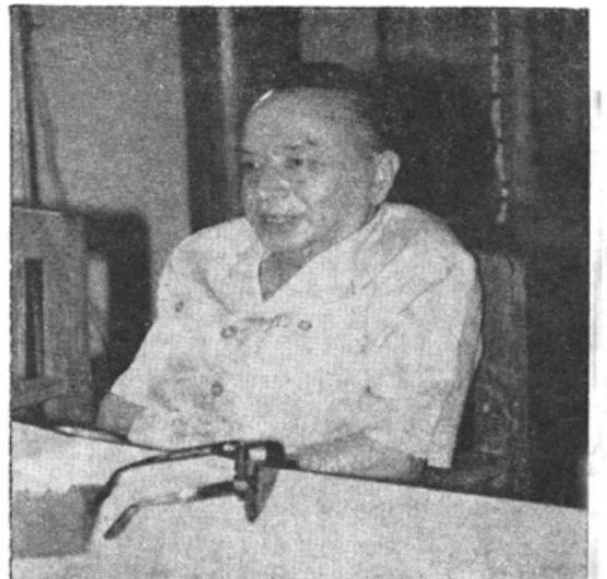
சிறிலங்காவின் நீதி அமைச்சர், ஜனாப் ஏ. சி. எஸ். ஹமீத்

அமைச்சர் ஹமீத் அவர்கள் இப்பிரச்சினையைத் தீர்க்கமாகத் தீர்ப்பதற்கான புதிய அடிப்படை அணுகு முறையை எடுத்துக் கூறி, தமிழீழ விடுதலைப் புலிகளின் ஆதரவையும் ஒத்துழைப்பையும் கோரினார்.