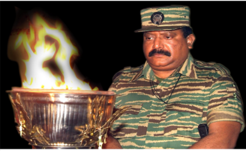
2005 மாவீரர் நாளில்...

மகிந்த உள்நாட்டில் தமிழின் அழிப்புப்போரை நடாத்திக் கொண்டு, உலகநாடுகளுக்கு சமாதானம் விரும்பும் ஓர் அமைதிப் புறாவாகத் தன்னை இனங்காட்ட முனைகிறார். தனது ஏமாற்று நாடகத்