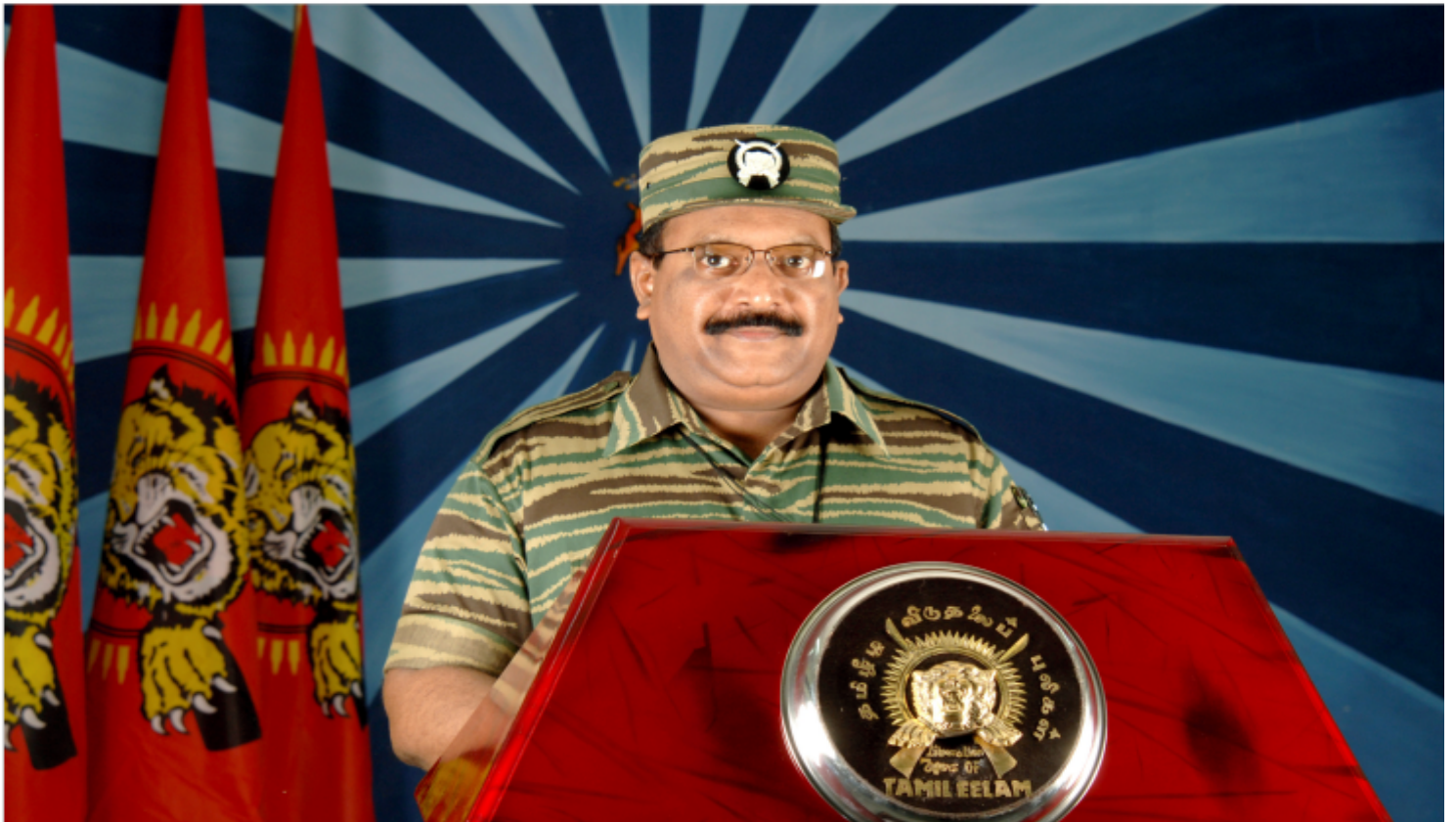
மாவீரர் நாளன்று தமிழீழத் தேசியத் தலைவர் மேதகு வே.யிரபாகரன் அவர்கள் உரையாற்றியபோது...

மனித நாகரீகம் தோன்றிய காலம் தொடரே மனிதகுலம் விடுதலைவேண்டி வீறுடன் போராடிவருகிறது. வீறுகொண்டெரியும் இந்தப் போராட்டங்களை அடக்கியொடுக்க ஆக்கிரமிப்பாளர்களும் அடக்குமுறையாளர்களும் காலங்காலமாகப் பல்வேறு உத்திகளைக் கையாண்டு வருகிறார்கள். முதலிற் போர் அரக்கனை ஏவுவதும் அது முடியாதுபோக, போரடும் இனங்களின் விடுதலைப் பாதையைத் திசை திருப்பி, அவர்கள் போகும் வழிகளெல்லாம் பொறிகள்வைத்து, சமாதானச் சதிவலைக்குள் சிக்கவைத்து, காலத்தால் மோசம் செய்து, சமாதான மாயைக்குள் தள்ளிவிட்டு, அமைதியாக அழித்தொழிப்பதும் வரலாற்றிலே நீண்ட நெடங்காலமாக நடந்துவருகிறது. இந்த உத்தியை எமது சுதந்திர இயக்கத்திற்கெதிராகவும் செயற்படுத்திவிடலாம் எனச் சிங்கள (உரையின் தொடர்ச்சி 11ஆம் பக்கத்தில்)