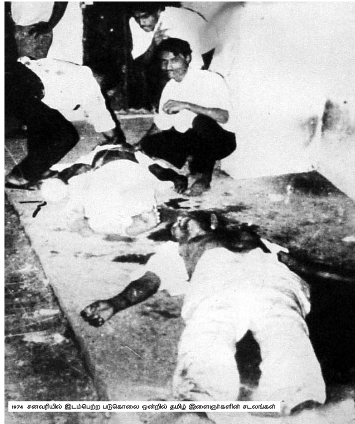
1974 சனவரியில் இடம்பெற்ற படுகொலை ஒன்றில் தமிழ் இளைஞர்களின் சடலங்கள்