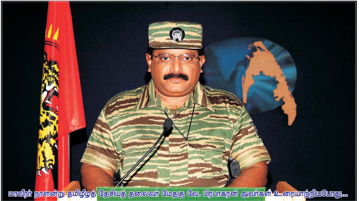
மாவீரர் நாள்ன்று தமிழீழத் தேசியத் தலைவர் மேதகு வே. பிரபாகரன் அவர்கள் உரையாற்றியபோது...