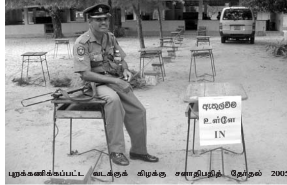
புறக்கணிக்கப்பட்ட வடக்குக் கிழக்கு சனாதிபதித் தேர்தல் 2005

அமைத்த ரணில் விக்ரமசிங்க அரசாங்கம் போர்நிறுத்த ஒப்பந்தத்தைத் தவிர சமாதான முயற்சியில் வேறெதைச் சாதித்தது. போர்நிறுத்த ஒப்பந்தமும் தமிழர்க்குச் செய்து என்ன! "புலிகள் இயக்கத்தை நசுக்க சர்வதேச வலைப் பின்னலைத் தனது அரசாங்கம் உருவாக்கி வந்தது" என்று ரணில் தம்பட்டம் அடித்திருந்தார்.