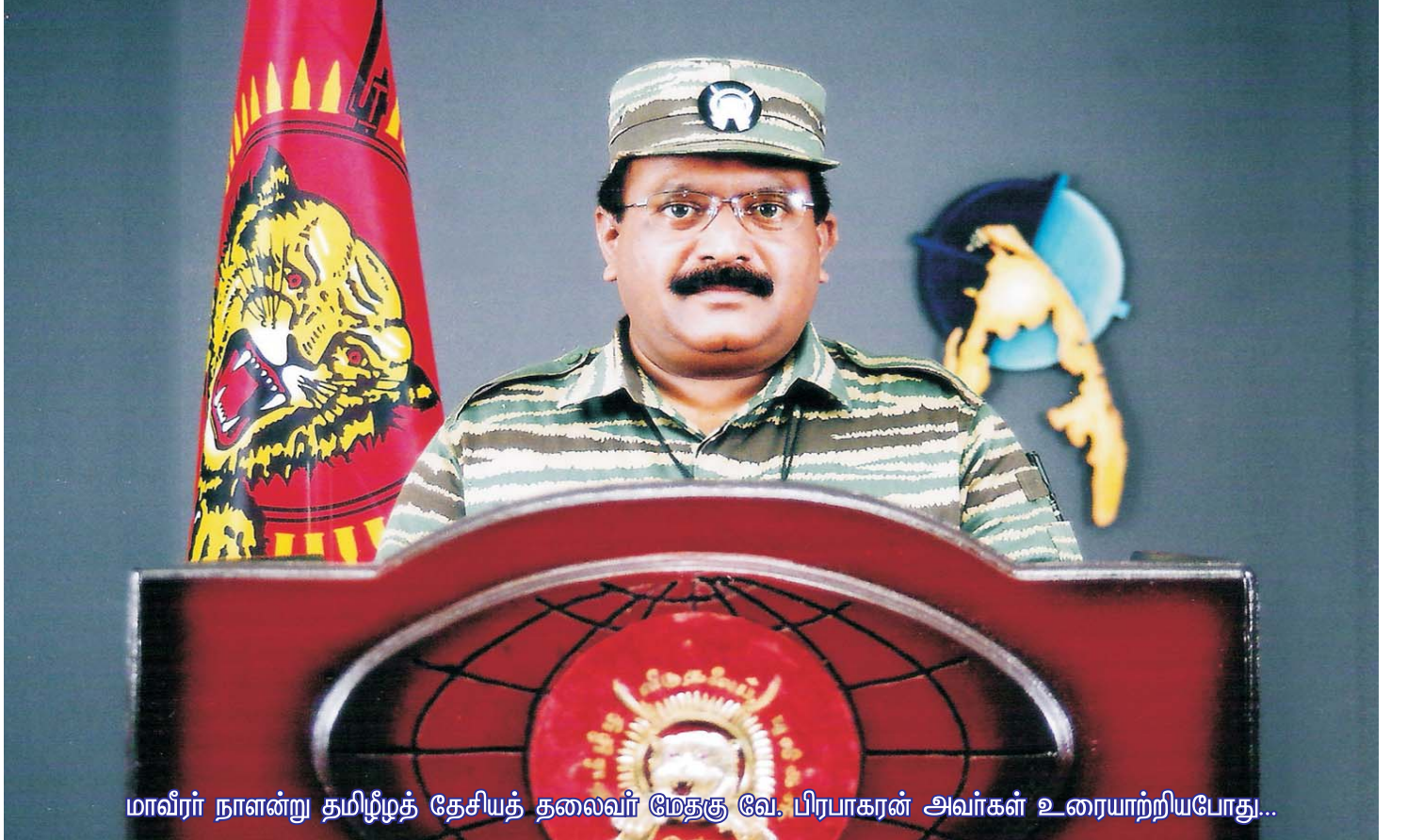
மாவீரர் நாளன்று தமிழீழத் தேசியத் தலைவர் றேதகு வே. பிரபாகரன் அவர்கள் உரையாற்றியபோது...

மூன்று தசாப்தங்களாகத் தொடர்ந்த எமது வீர விடுதலைப் போராட்டத்தில் எமது மாவீரர்கள் புரிந்த மகத்தான தியாகங்கள் காரணமாக ஒப்பற்ற போரியற் சாதனைகளை நாம் நிலைநாட்டினோம். உலகமே வியக்கும் வகையிற் போர் அரங்குகளில் எதிரிப் படைகளை விரட்டியடித்து வெற்றிகளை ஈட்டினோம். சிங்கள இராணுவ ஆக்கிரமிப்புக்கு ஆளாகியிருந்த எமது தாயக மண்ணின் பெரும் பகுதியை மீட்டெடுத்து அங்கெல்லாம் எமது நிர்வாக ஆட்சியதிக்காரத்தை நிறுவினோம். உலக நாடுகளின் உதவியுடன் கட்டியெழுப்பப்பட்ட சிறீலங்கா அரசினது ஆயுதப் படைகளுக்கு ஈடாகப் படை வலுச் சமநிலையை நிலைநாட்டினோம். தமிழீழ மக்களின் தேசிய விடுதலைப் போராட்டத்தைச் சர்வதேசமயப்படுத்தி, உலகத்தின் கவனத்தை எம்மீது திருப்பினோம். எனினும் எமது மாவீரர் கண்ட இலட்சியக் கனவு இன்னும் நிறைவுபெறவில்லை. எமது தாயகமண் இன்னும் முழுமையாக விடுதலை (உரையின் தொடர்ச்சி 15ஆம் பக்கத்தில்)