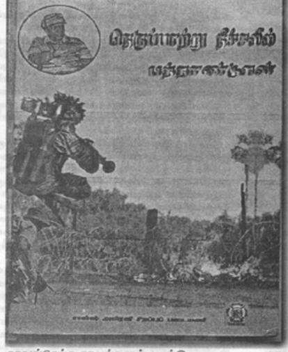
காவல்செய்த காவல்களும் உண்டு. பின்னாளில் தமிழர்கள் தவறா மாளிகையைத் தாக்கியதாக சிங்களவர்கள் குற்றம் சாட்டிய ஒரு காலமும் உண்டு.