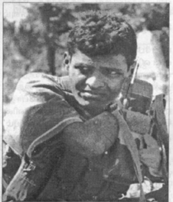
நகரணைக்கூட கைப்பற்ற முடியாமல் சிங்களப்படைகள் திணறிக்கொண்டிருந்தன.

ஜெயசிக்கு எதிரிச்சமர் வரலாற்றில் அந்த முப்பது நிமிடச் சண்டையும் முக்கிய இடத்தைப் பெற்றது. ஜெயசிக்குப் படைகள் 98 பெர்வரி 04க்குள் கண்டிவீதியைப் பிடித்து யாழ்ப்பாணத்தில் உள்ள சிங்களப் படைகளுக்கான விநியோகத்தை ஏற்படுத்தவில்லை என்ற பதில் பாதுகாப்பு அமைச்சரின் காலக்கெடுவை ஏழு மாதங்கள் கடந்திருந்தன. மாங்குள