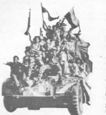
வெற்றி கொண்ட புரட்சியாளர்கள் தலைகூட்டுகின்றனர்.

தனது இராணுவ ஊடுருவல்கள் தேவ்வீ அடைந்ததால் பொருளாதார முடக்கலை ஏற்படுத்தி நிகரவாசா மக்களை அடிபணியச் செய்ய அமெரிக்க ஏகாதிபத்திய அரசு முயன்றது. இதன்படி 85 மே மாதம் ரீகன் அரசாங்கம் நிகரவாசா மீது பொருளாதார தர்ப்படைகளை விடுத்தது. இது நாடுகள் மத்தியிலான வர்த்தக உறவுகளை துண்டித்து மட்டுமல்லாது உணவுத் தானியமாகிய கோதுமை ஏற்றுமதியை அமெரிக்கா நிறுத்தியது. இந்தப் பொருளாதாரத் தடைகள் நிகரவாசா மக்களுக்கு பாதிப்பை ஏற்படுத்திய போதும் மக்கள் உறுதி நாளாது புரட்சிப் பாதையில் வீறு நடை போட்டு வருகின்றனர். அமெரிக்க ஏகாதிபத்தியத்தின் தாக்கராத் திட்டங்களை எதிர்த்து தனது சேராடிய நிகரவாசா மக்களுக்கு உலக சமுதாயம் மத்தியில் பெரும் ஆதரவு திண்டு வருகிறது.