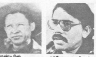
சாண்டியோ, தற்போதைய தலைவ டேனியல் ஆர்டோசு.

நிகரவாசா புரட்சி அமெரிக்க ஏகாதிபத்தியத்துக்கு ஒரு பேரிடியாக விழுந்தது. லத்தின் அமெரிக்க கண்டத்தின் புரட்சித் தீ பரவி தேசிய விடுதலைப் போராட்டங்கள் தீவிர மடைந்து தனது பொருளாதார அரசியல் ஆதிபத்தியத்துக்கு சவாலாக அமைவலாம் என பயந்தது. தனது ஏகாதிபத்திய நலன்களை நிலைநாட்டும் நோக்கில் நிகரவாசா மக்களின் புரட்சிகர அரசை கவிழ்ப்பதற்கு அமெரிக்கா திட்டம் தீட்டியது. இதன் அடிப்படையில் மூன்று அம்சமான (சித்தாந்த, இராணுவ, பொருளாதார) எதிர்ப்புரட்சித்திட்ட மொன்றை நிகரவாசாவுக்கு எதிராக அமெரிக்கா செயல்படுத்தத் தொடங்கியது.